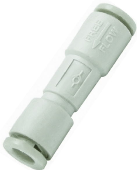
K Válvula de Retenção Plástica